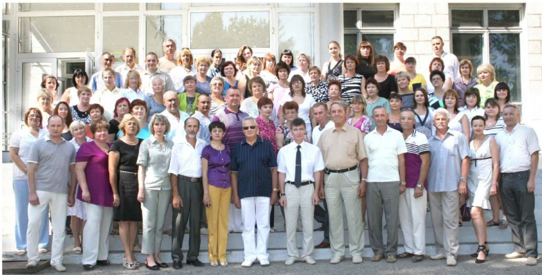
Коллектив Волгоградского энергетического колледжа, 2011 год