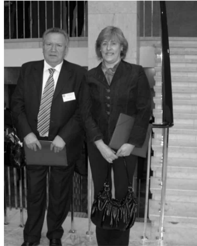
Кремлёвский дворец Съездов. Финал Всероссийского конкурса «Российская организация высокой социальной эффективности», 2008 год