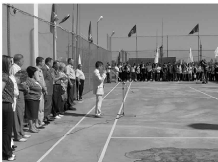
Всероссийская акция «Спорт против наркотиков!»