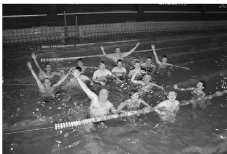
Участники Всероссийской олимпиады профессионального мастерства - 2013