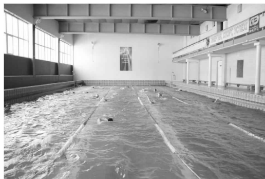
Комплекс бассейна Волгоградского энергетического колледжа