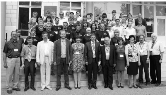
Конкурс профессионального мастерства контролеров сбытовых участков ОАО «Волгоградэнергосбыт», 2011 год