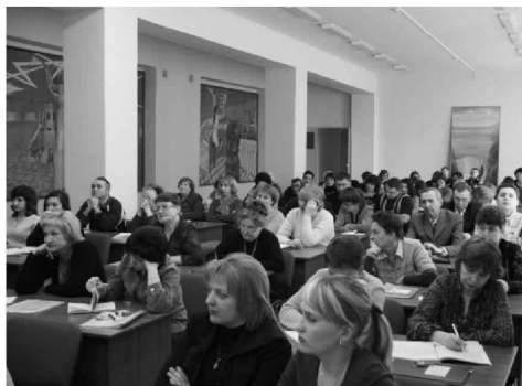
Заседание Педагогического совета с представителями социальных партнёров - начало работы над формированием содержания профессиональных компетенций, 2008 год