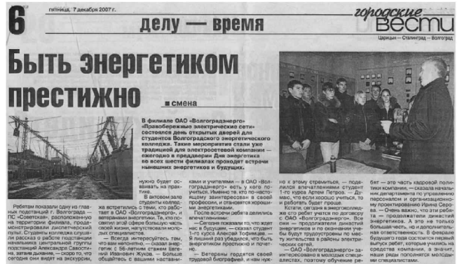
Городские вести 07.12.2007

Стало доброй традицией предоставление материально-технической базы колледжа для проведения крупных мероприятий социальных партнёров: конкурсов профессионального мастерства, соревнований производственных бригад, учебных семинаров, конференций, выставок, торжественных мероприятий.