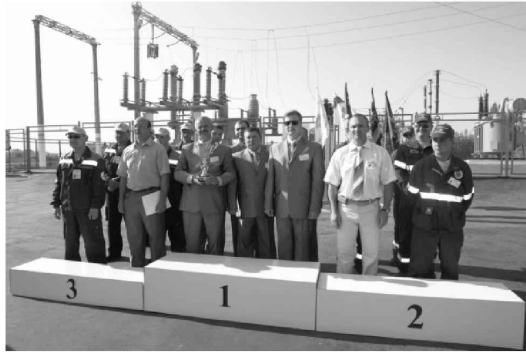
Соревнования бригад ОАО "МРСК Юга" на базе Волгоградского энергетического колледжа