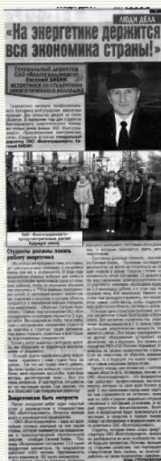
Космольская правда, 22.12.2006