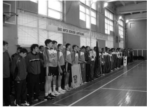
Спортивные соревнования филиалов ОАО "МРСК Юга" на базе спортивного комплекса Волгоградского энергетического колледжа