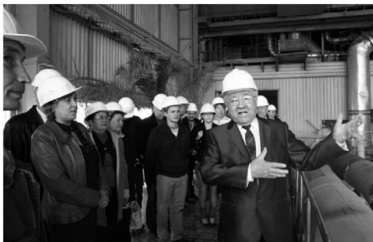
Участники Межрегионального семинара по социальному партнерству на ТЭЦ-3, 2012 год