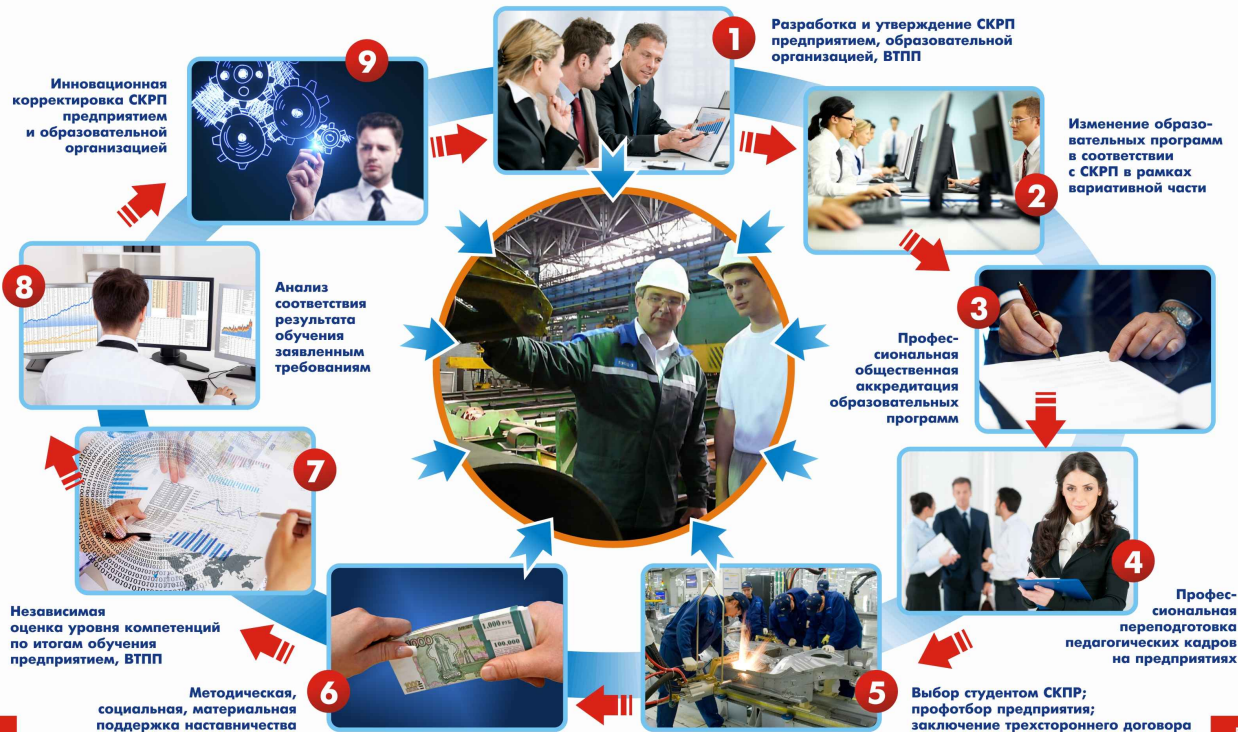
СХЕМА МОДЕЛИ ДУАЛЬНОГО ОБРАЗОВАНИЯ НА ОСНОВЕ СИСТЕМЫ КОМПЕТЕНЦИЙ РАБОТНИКА ПРЕДПРИЯТИЯ (СКРП)